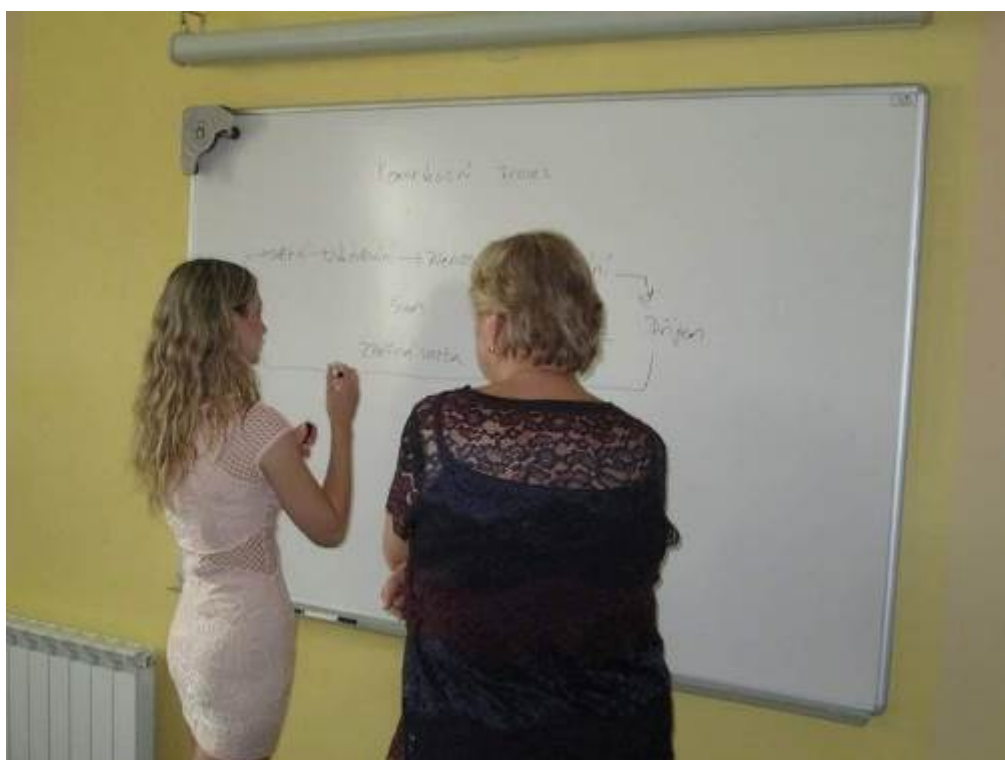
Ústní maturitní zkouška OM4