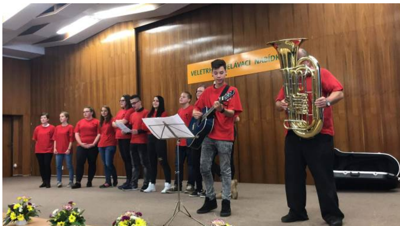
Veletrh vzdělávání SŠ