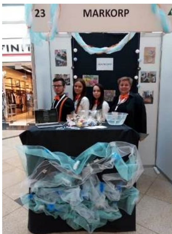
Veletrh studentských firem Praha