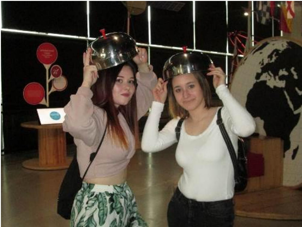
Vzdělávací exkurze - VIDA Brno