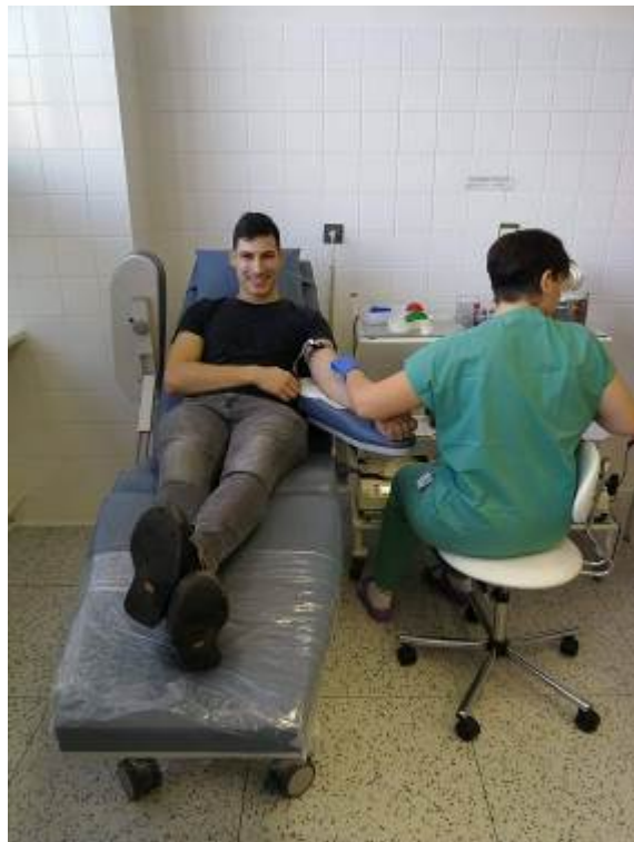
Projekt - 450 ml Naděje