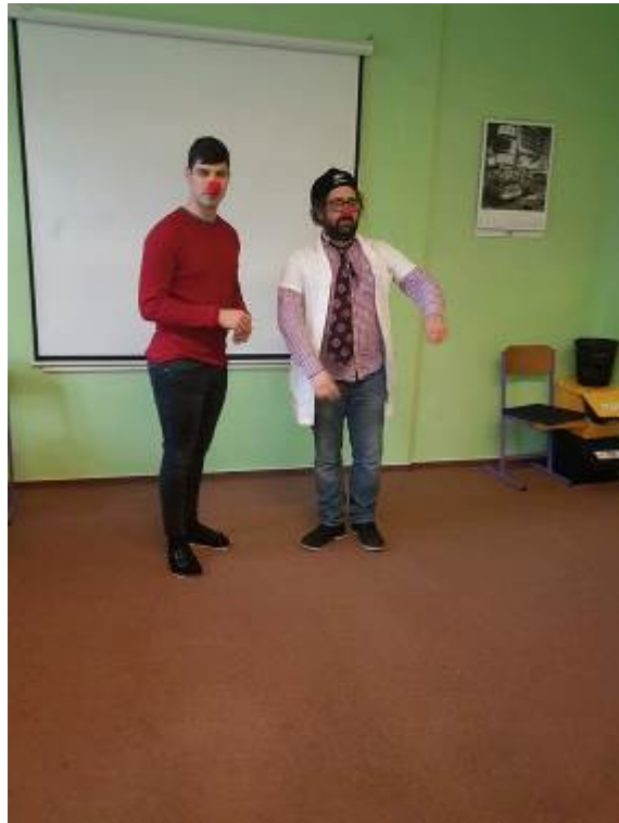
Odborná exkurze - Nemocniční klaun