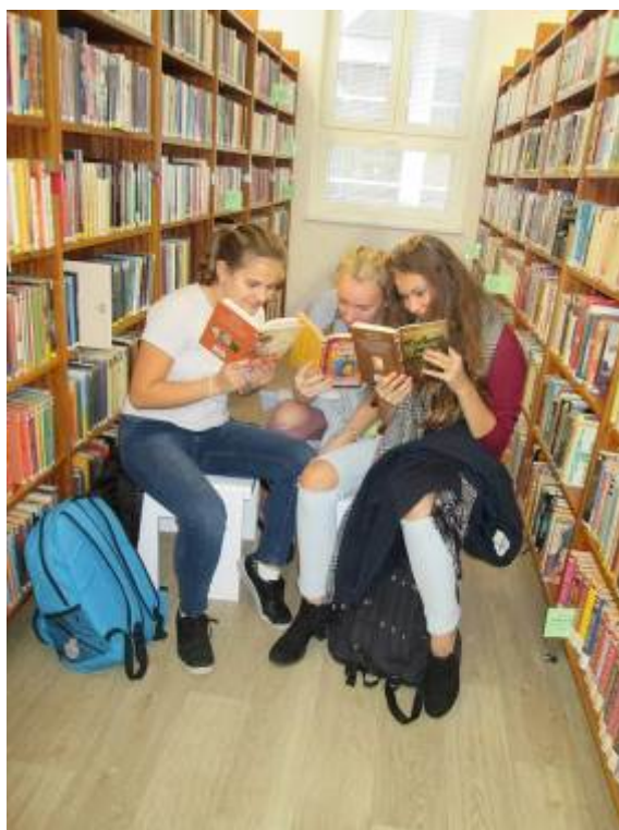
Vzdělávací exkurze v Městské knihovně