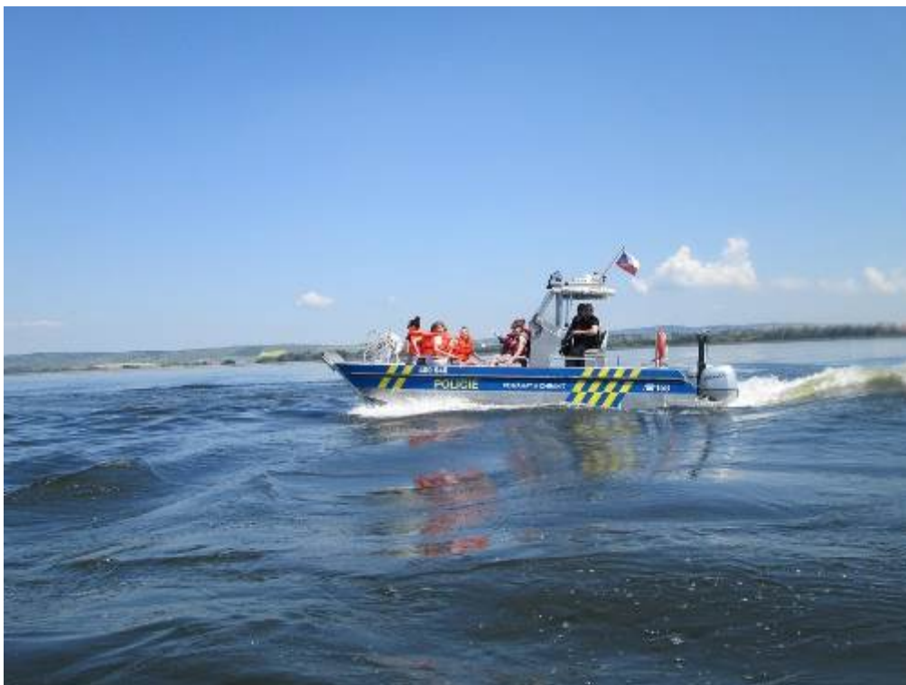
Odborná exkurze - Vodní záchranáři