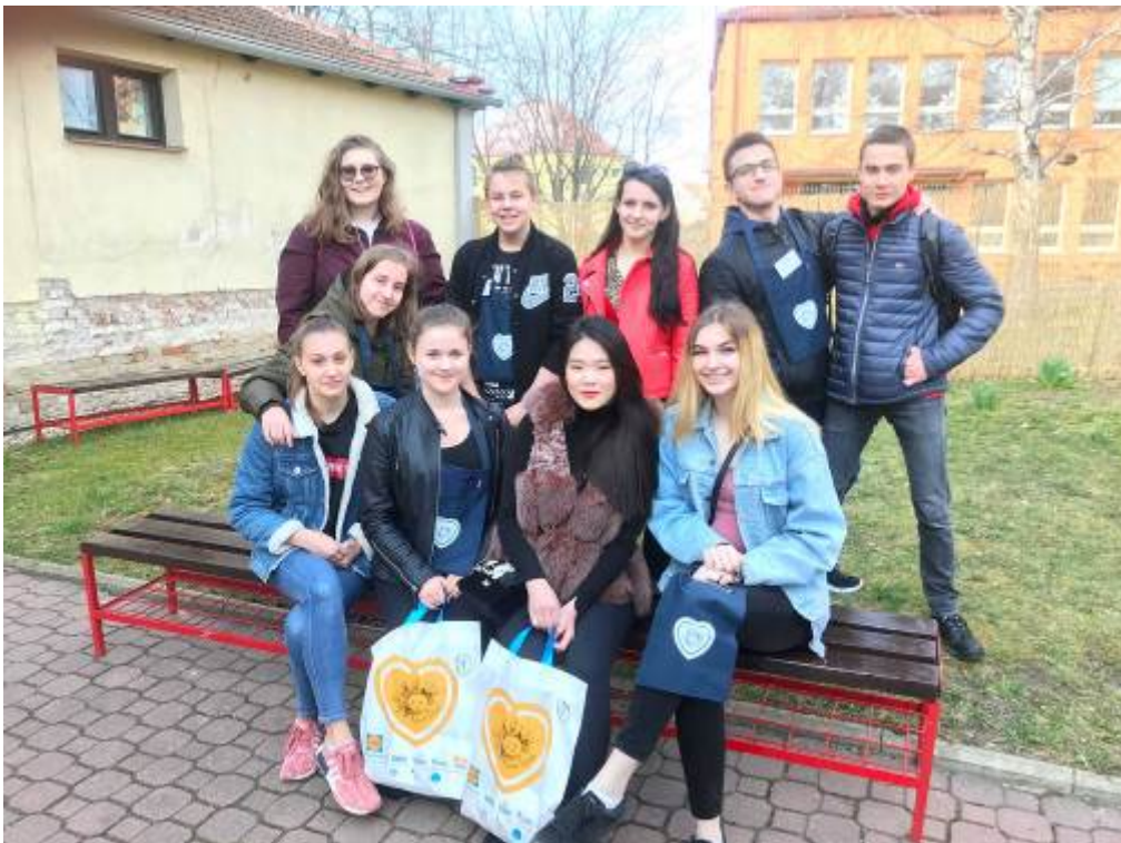
Sbírka Život dětem