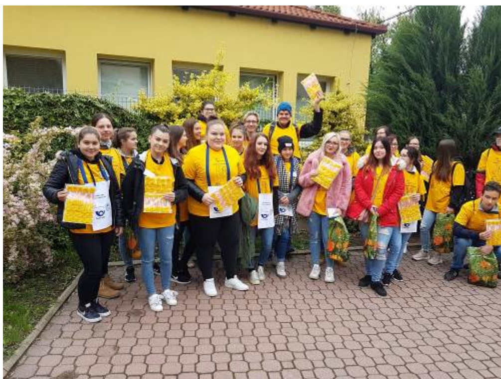
Květinový den – Liga proti rakovině