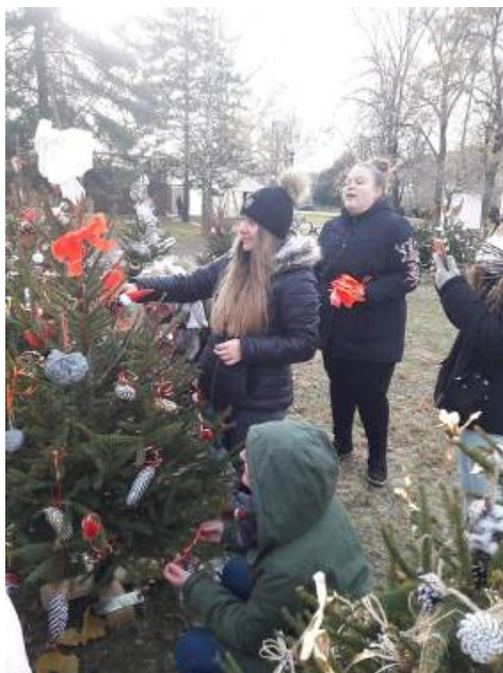
Zdobení vánočního stroměčku v městském parku