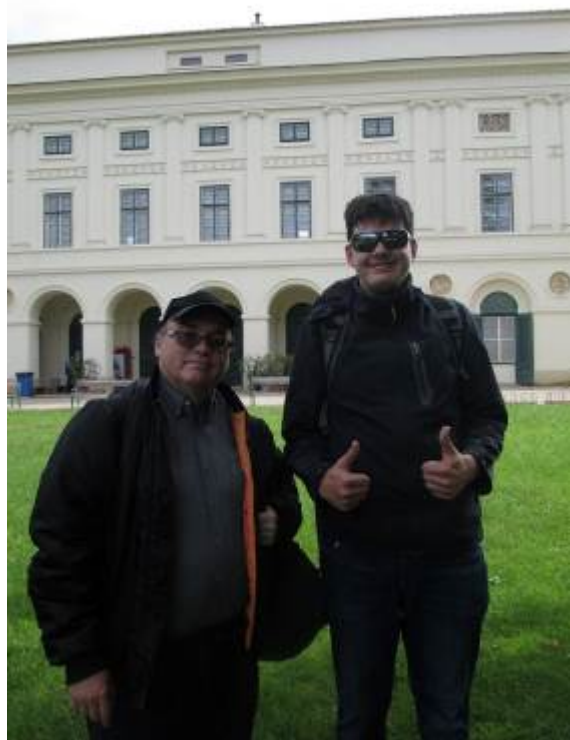
Sejdeme se na pikniku – Den dětí na Pohansku