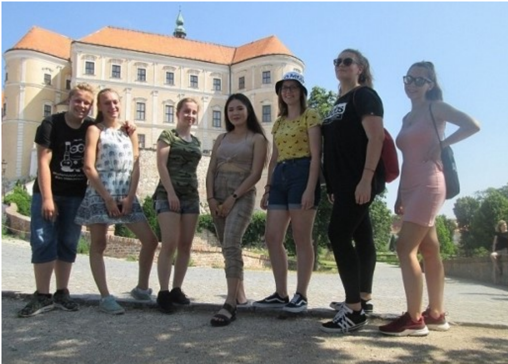
Školní výlet ZA2