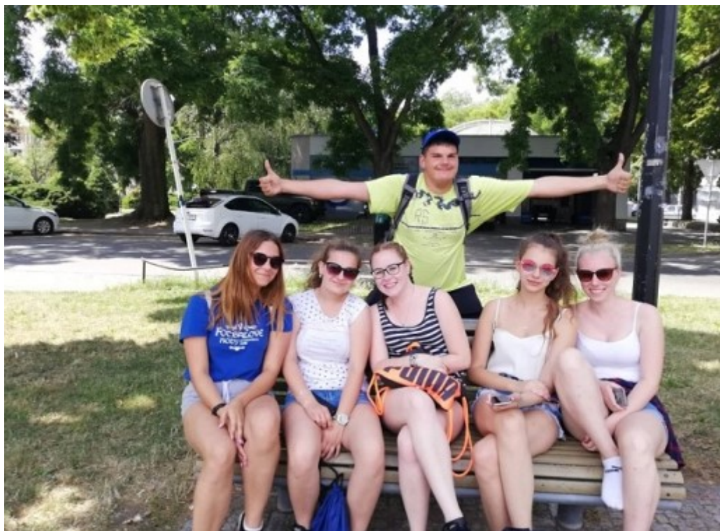
Školní výlet PS1/MM1