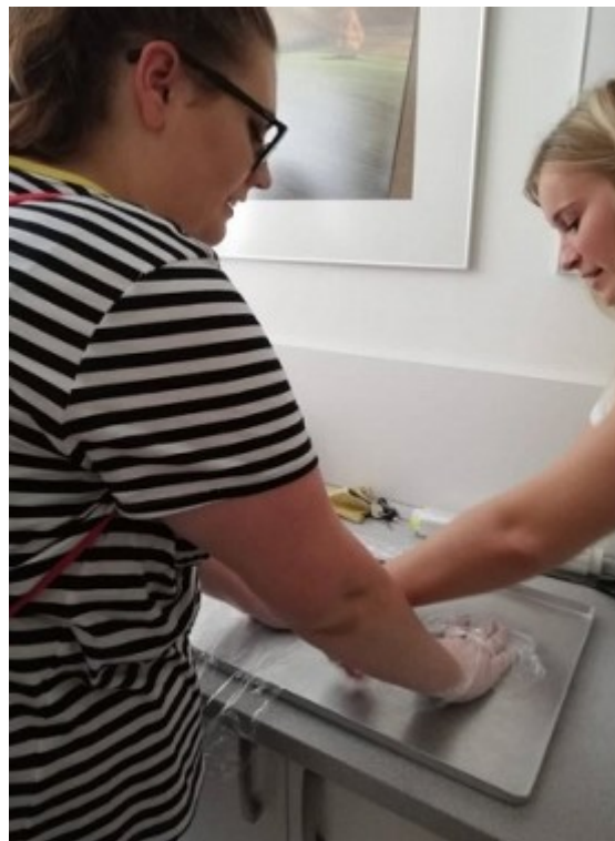
Odborná exkurze ZA2 v SPA Lednice