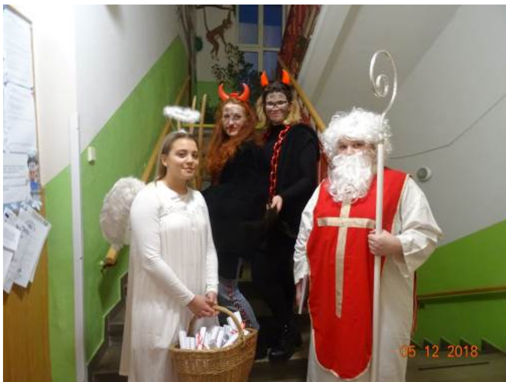
Mikuláš v Nemocnici Břeclav