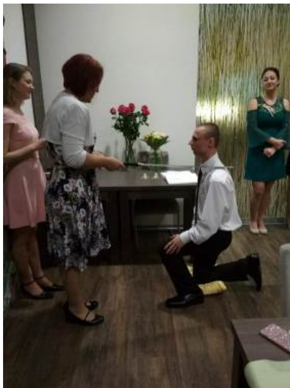
Stužkovací večírek OM4