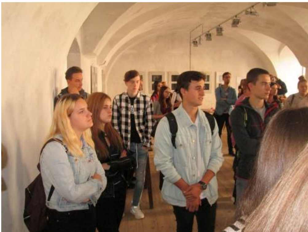
Vzdělávací exkurze – Věznice Cejl Brno