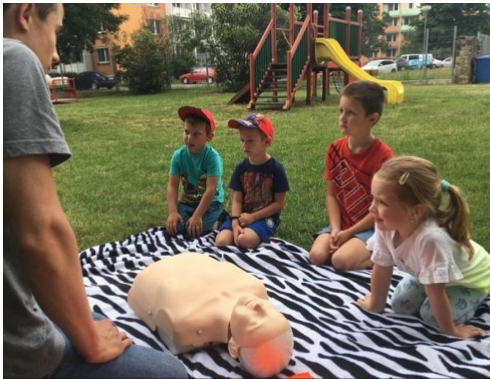
První pomoc pro mateřskou školku Dukelská/Kupkova