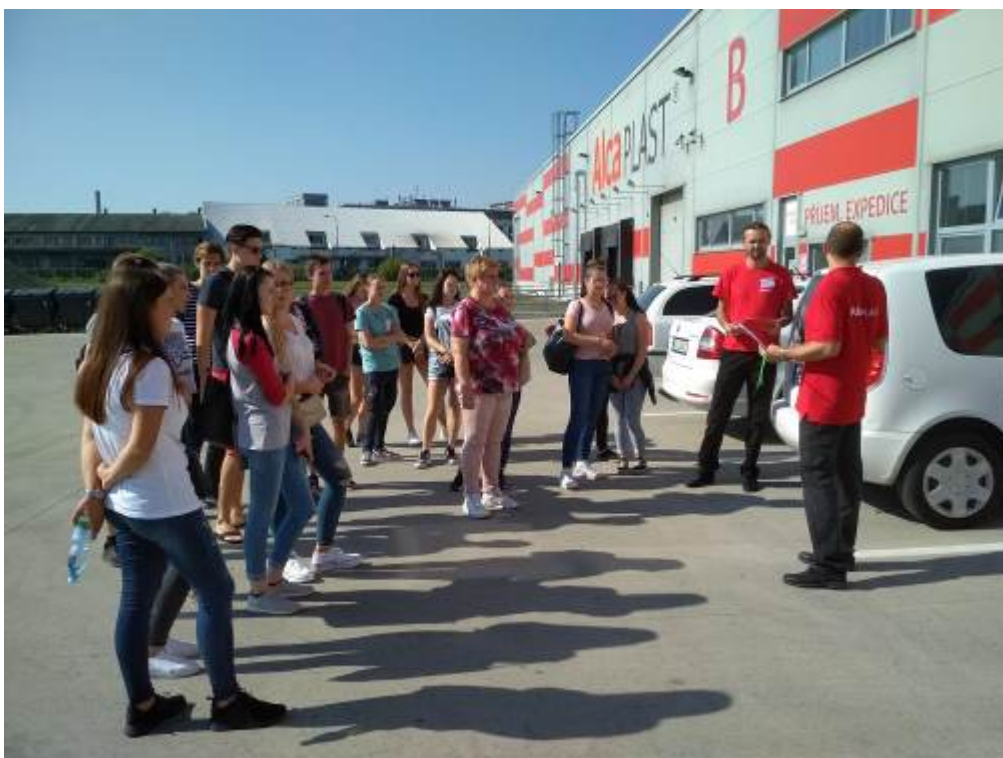
Odborná exkurze v Alcaplastu Břeclav