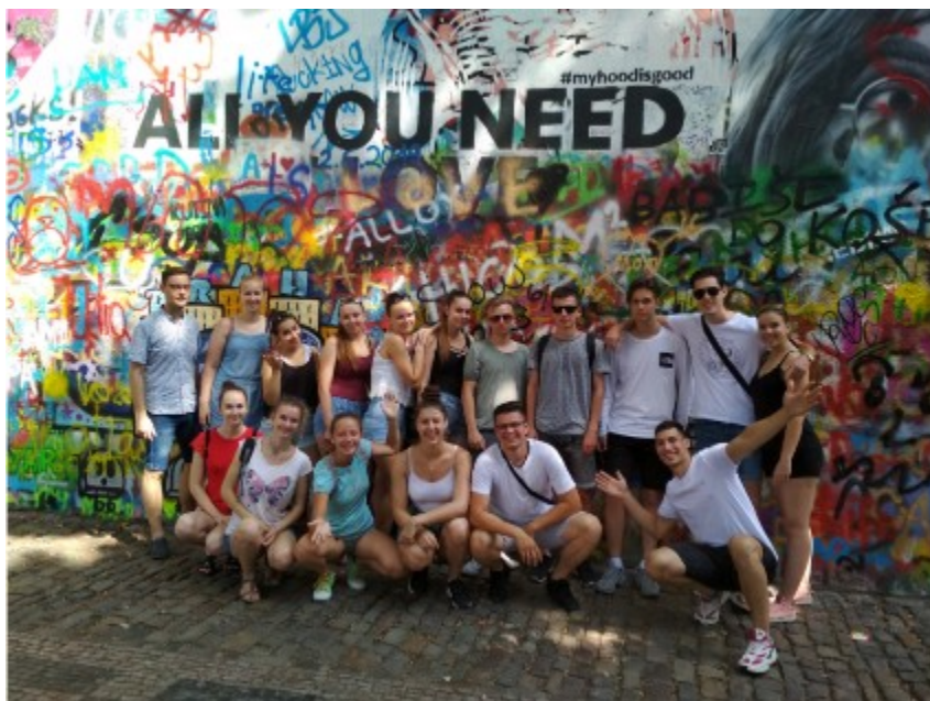
Vzdělávací exkurze Praha – OM4/ZA4