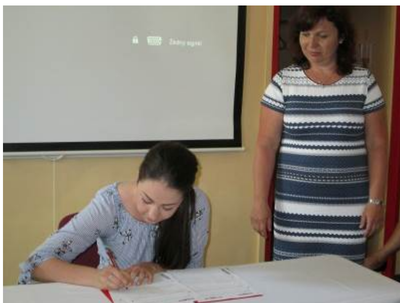
Předávání maturitního vysvědčení