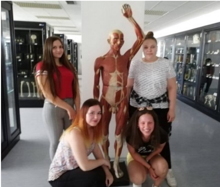
Odborná exkurze PS1 v anatomickém muzeu Brno