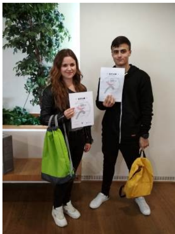
Bezpečně v kyberprostoru – krajské kolo