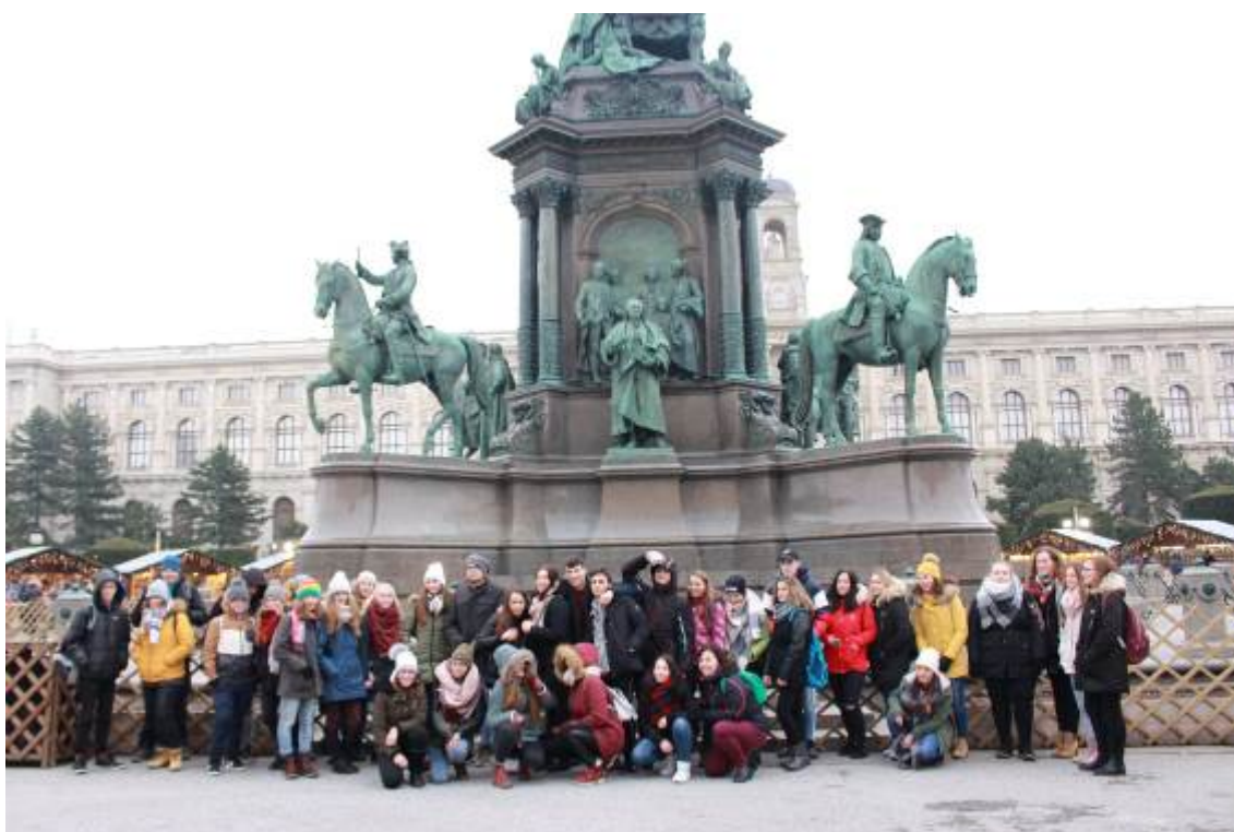
Vzdělávací exkurze - Vídeň