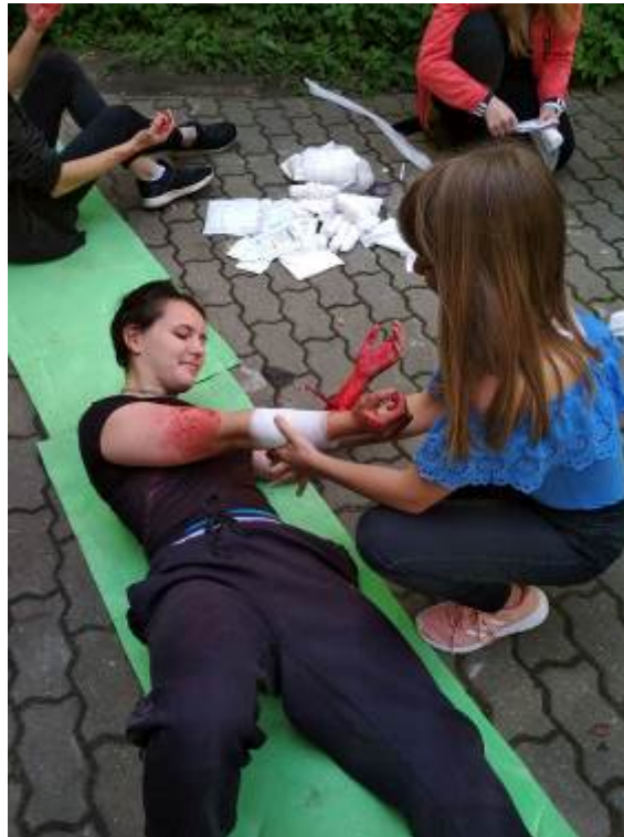
Kurz první pomoci pro žáky Gymnázia Břeclav