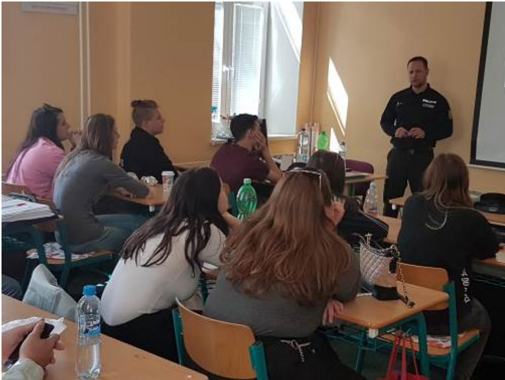
Projektový den - Den s Policií