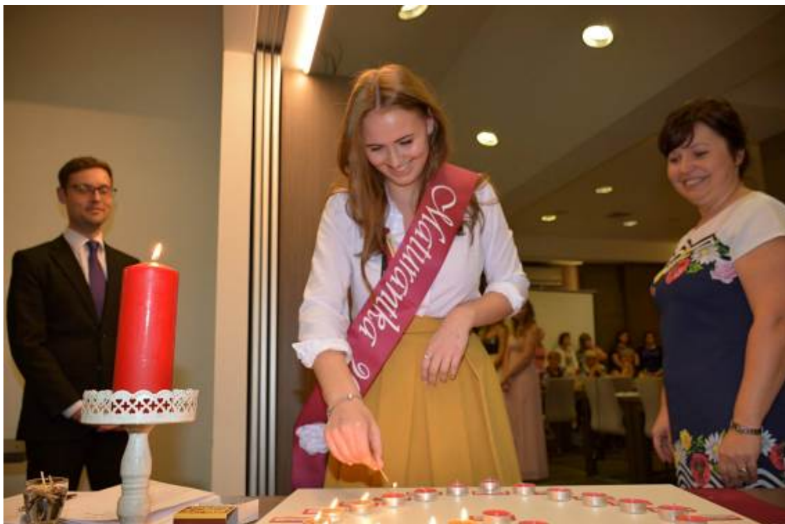
Stužkovací večírek ZA4