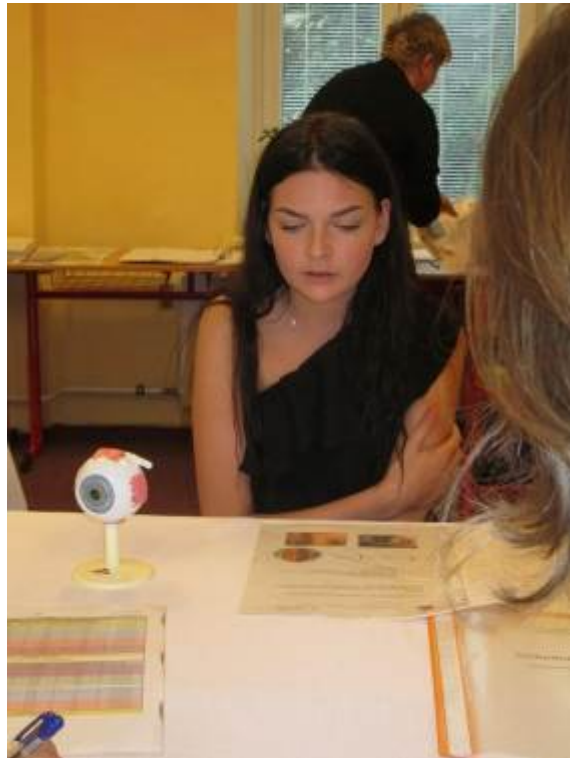
Ústní maturitní zkouška OM4