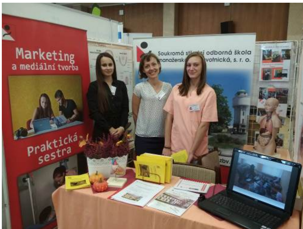
Veletrh vzdělávání SŠ