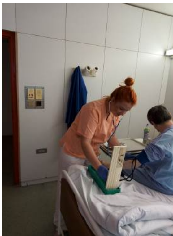
Praktická maturitní zkouška ZA4