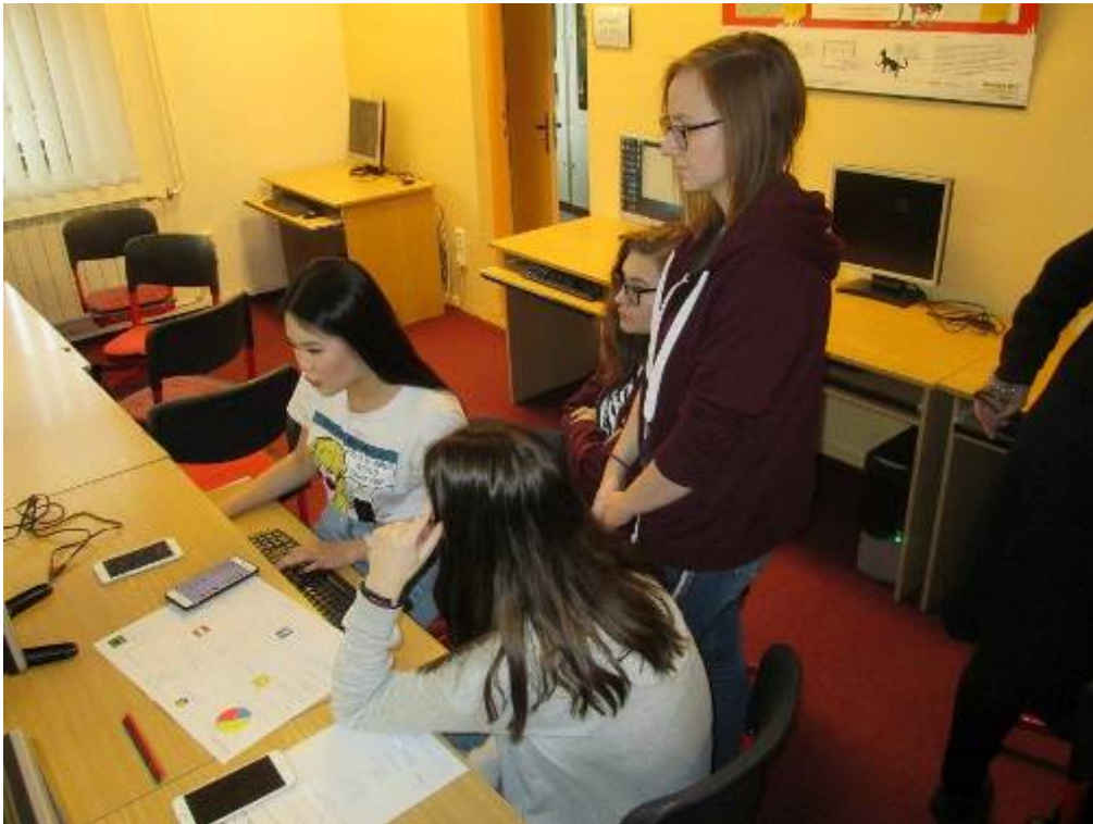
Projekt KaPoDav – Finanční gramotnost