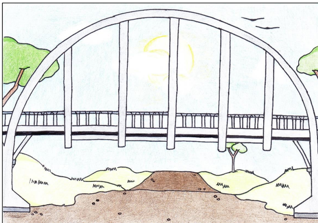
Ilustrace: Pavlína Babičová, ZA2