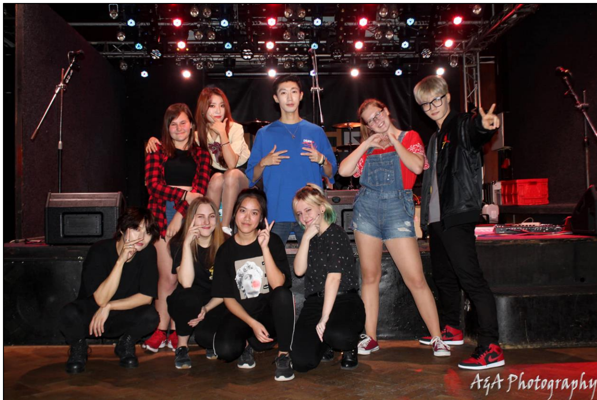
Společné foto taneční skupiny G.LUN s členy jihokorejské kapely Violet Tree.